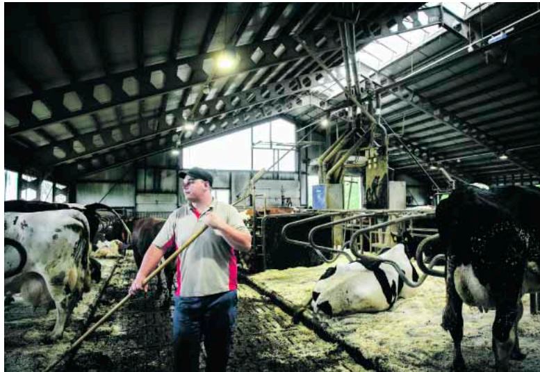
Kaikkiin maatilain töihin ei tekniikka ulotu. Isännän on tartuttava talikon varteen, sillä lanta on luotava käsipelillä.