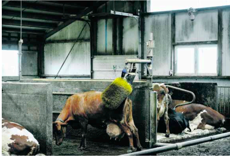
Lehmäkin kaipaa kosketusta. Aina ei isäntä ole paikalla, mutta rapsutuskone on. Yleensä halukkaita riittää jonoksi asti.

Etelä-Saimaa on läsnä lukijoiden arjessa, herättää puheenaiheita ja luo kanavan keskustelulle. Tärkein arvomme on ihminen.